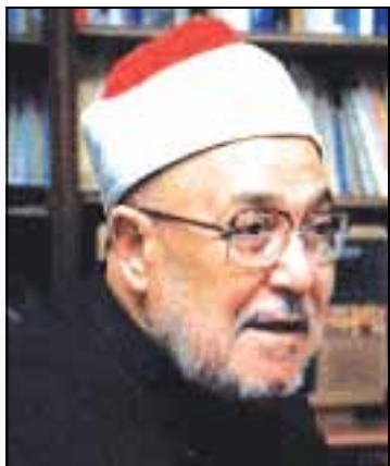
Shejkh Muhamed El-Gazali

N uk lejohet ngatërrimi mes ajeteve, të cilat prezantojnë thirrjen dhe ajeteve mbi ndërtimin e shtetit. Ajetet e para i drejtohen (flasin) një mendjeje bosh, që të njohë Zotin, ku në këtë rast, zakonisht, njeriu është injorant dhe mohues dhe, sapo t'i qetësohet zemra me besim, i themi: Jeta ka parime të tjera dhe obligime të reja!