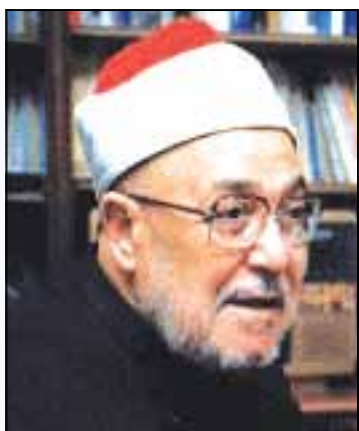
Shejkh Muhamed El-Gazali

N uk lejohet ngatërrimi mes ajeteve, të cilat prezantojnë thirrjen dhe ajeteve mbi ndërtimin e shtetit. Ajetet e para i drejtohen (flasin) një mendjeje bosh, që të njohë Zotin, ku në këtë rast, zakonisht, njeriu është injorant dhe mohues dhe, sapo t'i qetësohet zemra me besim, i themi: Jeta ka parime të tjera dhe obligime të reja!