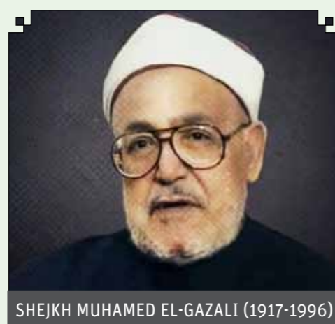
SHEJKH MUHAMED EL-GAZALI (1917-1996)