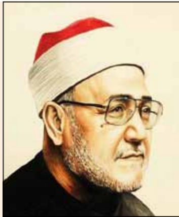
Shejkh Muhamed El-Gazali

Nuk njoh asnjë prej dijetarëve fukaha (juristë) që të ketë refuzuar këngën fetare, prandaj kush është ai që urren nxitësit e dashurisë për Allahun, madhërimin e emrave dhe falënderimin për begatitë e Tij? Dhe, kush e urren nxitimin drejt Tij, të qamurit për neglizhencën dhe humbjen e hakut të Tij?