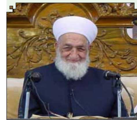
SHEJKH AHMED KEFTARO (1912-2004)

ndalemi e të shohim se ku jemi dhe ku po shkojmë?!