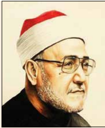
Sheikh Muhamed El-Gazali

M edito me mua rreth kësaj anekode: Një njeri po ecte i shkujdesur në rrugë, pa i kushtuar vëmendje asnjë rreziku. Papritur, një hajdut i armatosur i del dhe ia merr me forcë portofolin e tij dhe, pastaj i thotë: Ec, vazhdo rrugën!