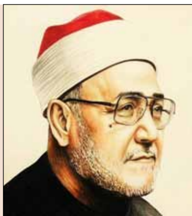
Shejkh Muhamed El-Gazali

P rej fatkeqësive, me të cilat jam ndeshur në rrugën e thirrjes, janë disa njerëz, që kanë dëshira të çmendura për vendime harami (ndalesash) në çdo gjë! Nëse do të kishin mundësi të ndalonin (bënin haram) ajrin, patjetër do të kishin dhënë fetva për këtë gjë, edhe nëse do të vdisnin të asfiksuar së bashku me njerëzit e tjerë.