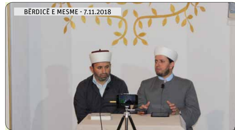
BËRDICË E MESME - 7.11.2018