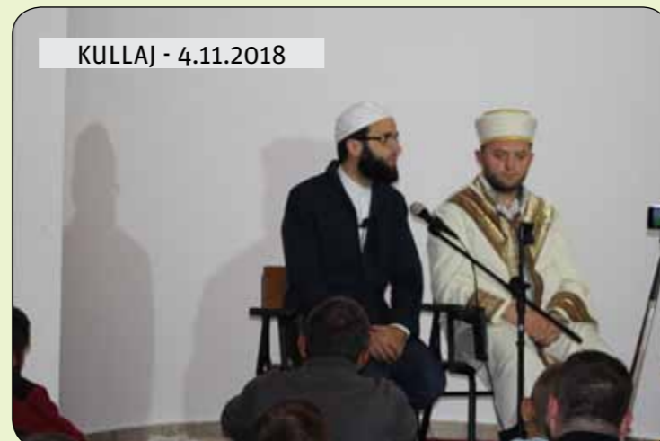
KULLAJ - 4.11.2018