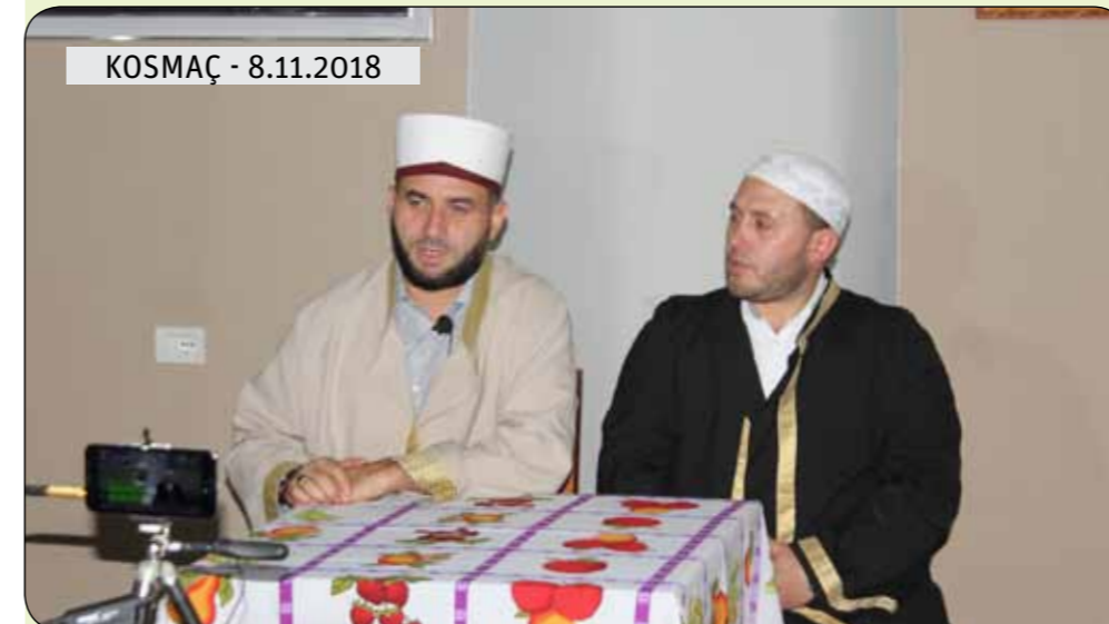
KOSMAÇ - 8.11.2018