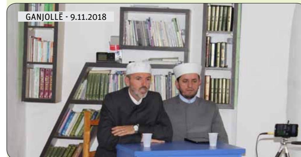
GANJOLLË - 9.11.2018