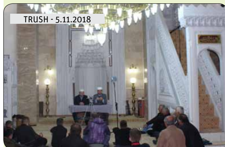
TRUSH - 5.11.2018