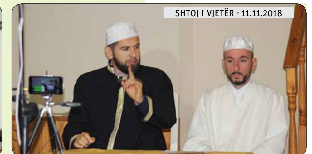
SHTOJ I VJETËR - 11.11.2018