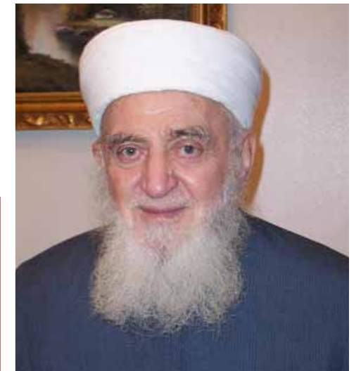
PEJGAMBERI (A.S.) KA THËNË: "AJO ËSHTË NJË DITË NË TË CILËN UNË KAM LINDUR!"

"Shohim se ai Zotëri (a.s.) përmendi ditëlindjen e tij dhe na mësoi me e ditë