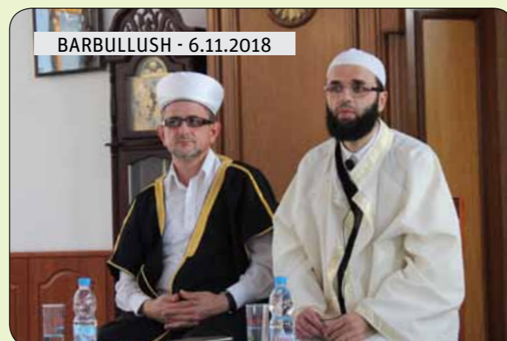
BARBULLUSH - 6.11.2018