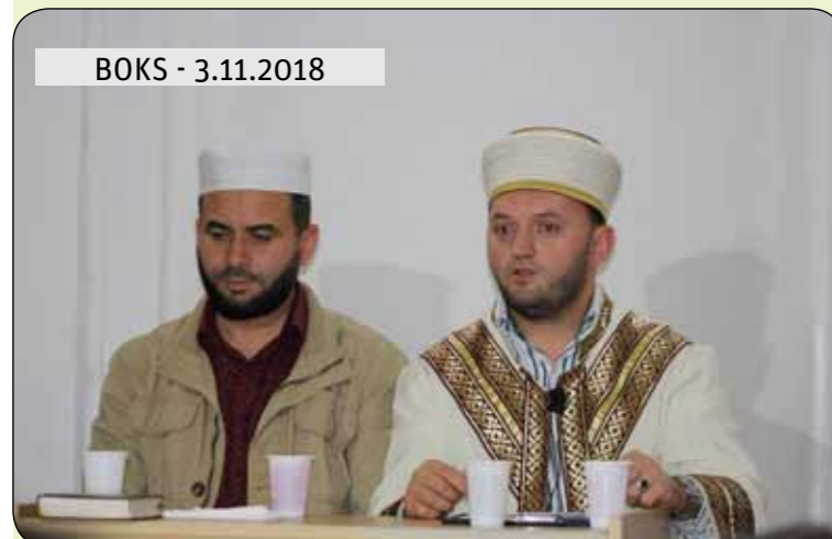
BOKS - 3.11.2018