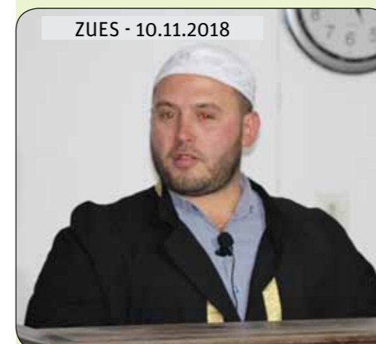
ZUES - 10.11.2018