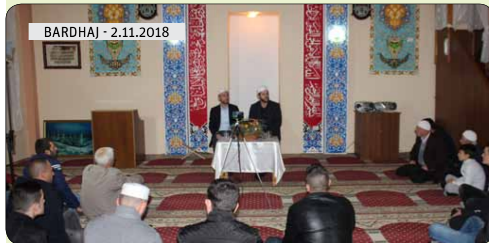
BARDHAJ - 2.11.2018