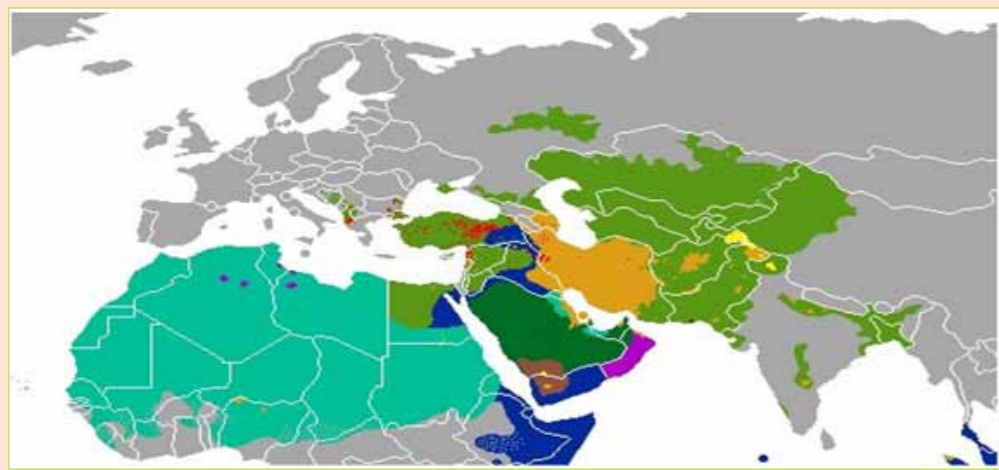
Ngjyra e gjelbër e hapur tregon përhapjen e Medhhebit Hanefi në botën islame

Ebu Hanife ishte emri me të cilin njihej ky dijetar i shquar i Islamit, ndërsa emri i tij i vërtetë është En-Nu'man ibn Thabit ibn El-Merzuban. Me origjinë ishte nga vendet e Persisë, nga Kabuli, kryeqyteti i Afganistanit. Familja e tij ishte një familje e respektuar. Gjyshi i tij, Merzubani, hyri në fenë islame në kohën e kalifit Omer (r.a), pastaj erdhi në Kufe, në Irak, dhe aty u vendos të banonte.