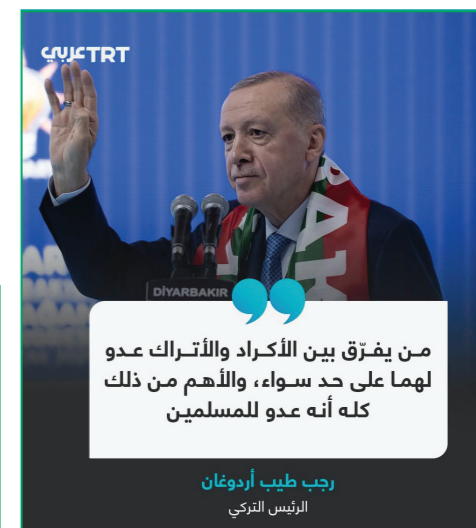
REXHEP TAJIP ERDOĞAN PRESIDENT I TURKIJES

“ N E JEMI NË HALLKËN N E FUNDIT TË T HYERJES SË LOJËS I MPERIALISTE, E CILA I KA SHKAKTUAR DHIMBJE K ËTIJ YMETI, PËR QATI N JË QJYSMË SHEKULLI!