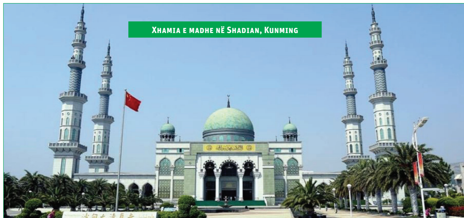
XHAMIA E MADHE NË SHADIAN, KUNMING

Sipas legjendës, Sai Diançi themeloi 12 xhami në Shançan (Kunming-u i sotëm). Sipas Junnan General Chronicles, xhamia Nançeng dhe xhamia Jongning në Kunming, të dyja këto u ndërtuan nga Sai Diançi. Në vitin 1279, eksploratori italian Marko Polo, kur po udhëtonte në Junnan, ai pa se Kunming ishte: "...Një qytet i madh dhe i shtrenjtë, me shumë tregtarë dhe punëtorë. Atje ka disa lloje njerëzish. Atje ka myslimanë, idhujtarë dhe disa të krishterë nestorianë". Marko Polo përmendi fillimisht se: "Atje ka myslimanë.", nga ku mund të nxjerrim përfundimin për numrin e madh të myslimanëve në Junnan gjatë Dinastisë Juan.