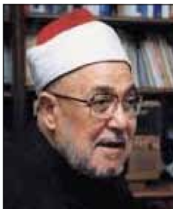
Sheikh Muhamed El-Gazali (1917 – 1996)

Islami ka shtyllat dhe parimet e tij mbi të cilat mbështetet, që i ngjajnë ajeteve të qarta (ajat muhkemat), dhe që janë baza e fesë dhe thelbi i saj!